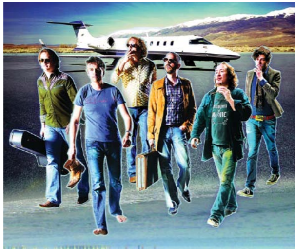
The Dutch Eagles.